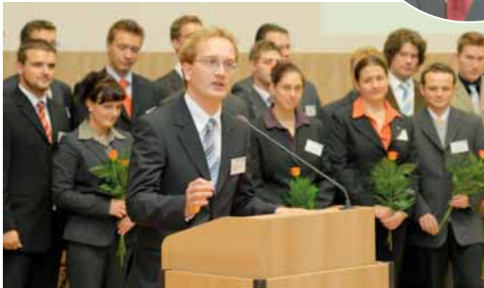
Das „Racetech Racing Team der TU Bergakademie Freiberg“ bedankte sich beim Industrieverein für den Industrieverein-Förderpreis „Richard Hartmann“ und präsentierten ihre bisherige Arbeit in einem Film.