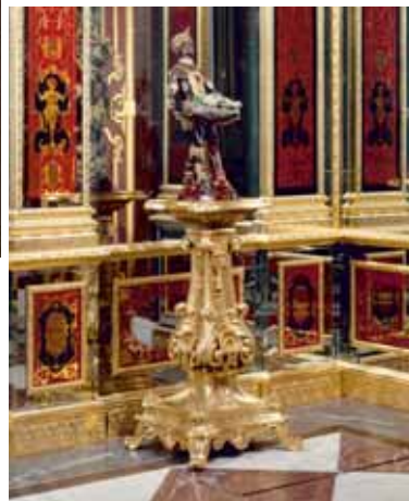
Grünes Gewölbe, Staatliche Kunstsammlungen Mohr mit der Smaragdstufe. Blick in das Juwelenzimmer des Historischen Grünen Gewölbes.